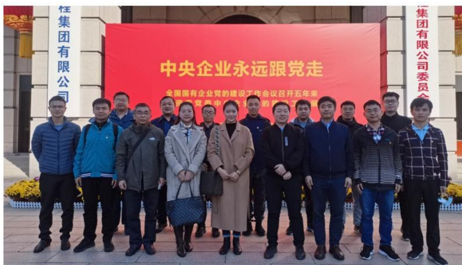
图1 研究生参加“中央企业跟党走”主题展览

研究所党支部。在院党委统一领导下结合研究所党支部具体要求，主要通过党建主题教育学习，深化思想引导；参加专题教育活动，强化素质提升，充分发挥基层研究生党、团组织在研究生思想政治教育中的主体作用，不断提高研究生自我教育、自我管理和自我服务的能力，同时导师在学术活动中融入研究生思想政治教育内容，促进研究生的学术科研能力和思想道德素质同步提高。