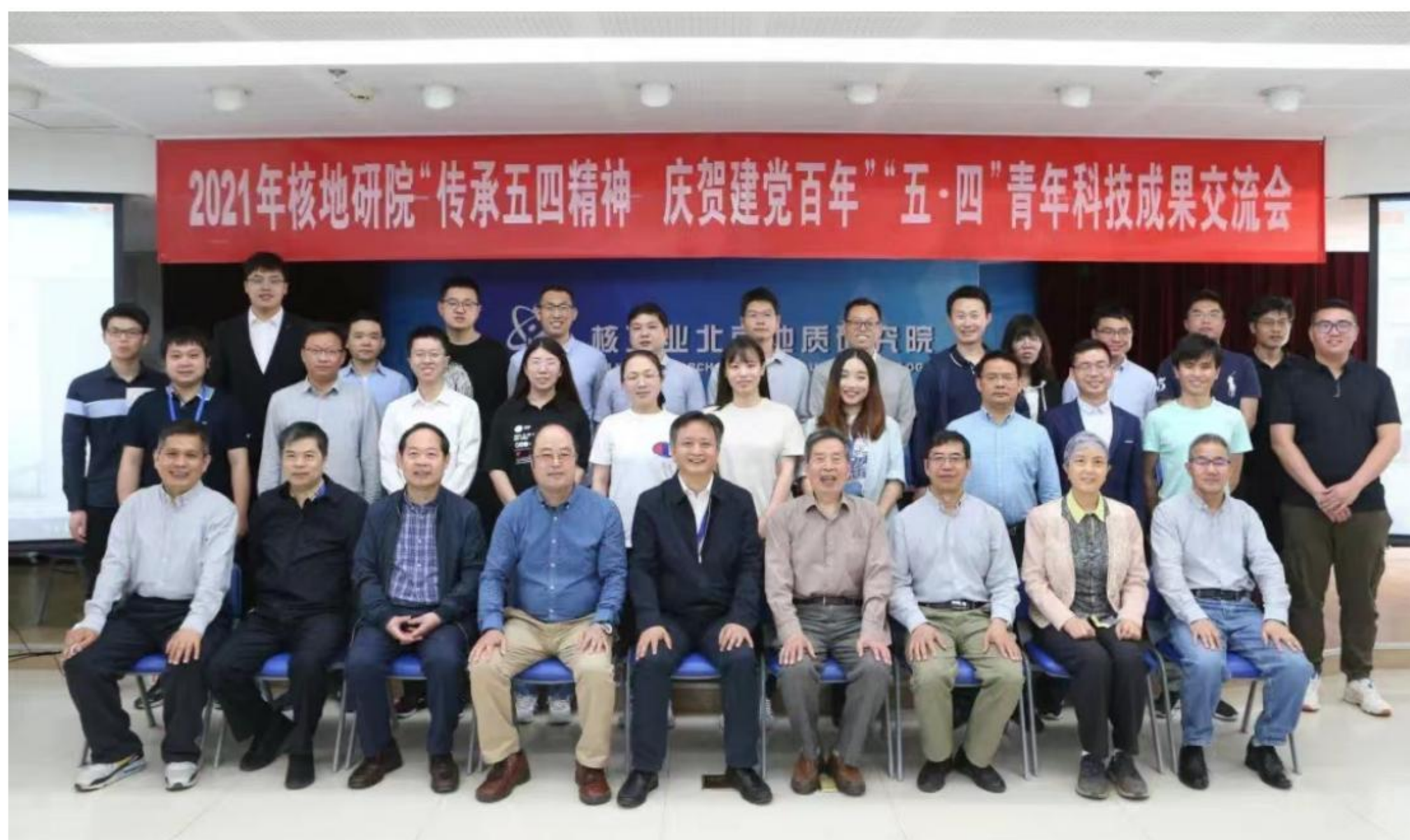
图3 核地研院学术交流平台—“五四”青年科技交流会